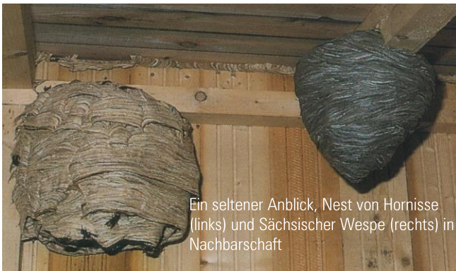
Ein seltener Anblick, Nest von Hornisse (links) und Sächsischer Wespe (rechts) in Nachbarschaft

Wespennester sind einjährig. Jedes Jahr wird ein neues Nest gebaut. Das alte Nest wird aufgegeben und kann im Winter nach mehreren Frosttagen entfernt werden.