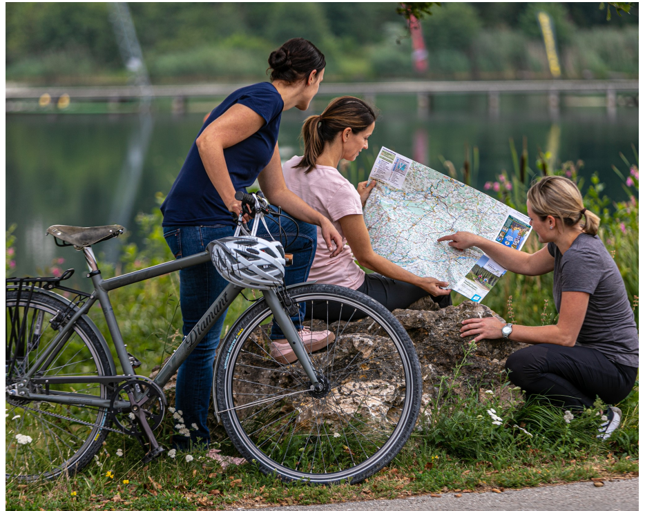
Auf den Spuren des Bieres bei der Brauereitour Süd.

Alle Naturliebhaber erwartet eine große Auswahl an Wanderstrecken und Themenradwegen, die zu einem abwechslungsreichen Ausflug einladen. Die durchgängig ausgeschilderten Routen führen vorbei an erfrischenden Weihern und Badeseen, durch Flusstäler und über Hügel. Dabei können die Besonderheiten unserer heimischen Natur, gepaart mit großartigen Aus- und Weitblicken, genossen werden. Hopfengärten, blühende Wiesen und Spargelfelder geleiten Sie auf Ihren Touren.