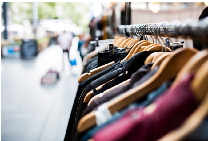
Nachhaltige Kleidung ist voll im Trend. Das vhs-Seminar „Fast Fashion - Slow Fashion“ zeigt Alternativen zu kurzlebigen Modetrends.