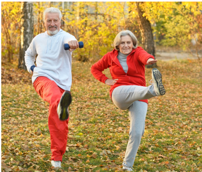
Bewertet werden insbesondere Kriterien, wie z. B. „Verbesserung der Lebensqualität der Senioren“

2018 ging der Preis an den Bürgerverein Markt Manching für das Projekt „Hilfe für den Nächsten“. Die Nachbarschaftshilfe Manching des Caritas-Zentrums Pfaffenhofen war 2020 der zweite Träger des Seniorenpreises mit ihrem Projekt „Seniorentreff der Nachbarschaftshilfe Manching mit Seniorengymnastik, Kleiderkammer und Einzelfallhilfe“.