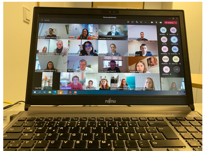
Aufgrund der Pandemie-Situation fand die Sitzung des Jugendkreistages in Form einer Videokonferenz statt.