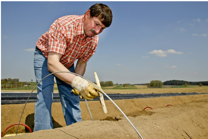
Bei den heimischen Spargelerzeugern gibt es den Spargel frisch vom Feld.

Neben dem Hopfen ist unser Landkreis auch ein wichtiges Anbaugebiet für das „königliche Gemüse“, den Spargel. Weit bekannt ist, dass man diesen am besten direkt beim Erzeuger kauft, denn frischer geht es wirklich nicht! Wer den Kochlöffel nicht selbst schwingen möchte, findet in unserer abwechslungsreichen Gastronomielandschaft ausreichend Möglichkeiten, sich mit Spargelkreationen verwöhnen zu lassen.