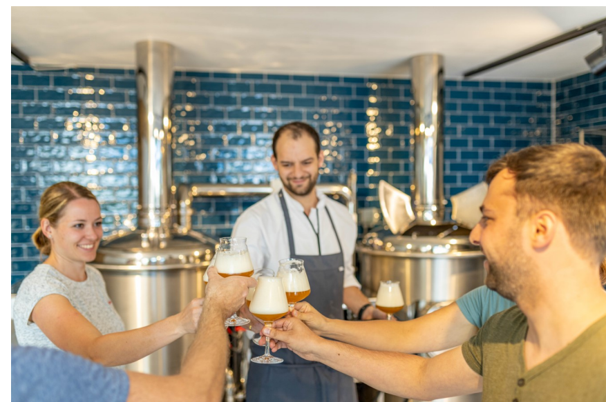
Zeit für eine Bierprobe muss sein!

Die Brauereitour Süd vereint Bier, Geselligkeit, Heimat und Tradition. Von der Klosterbrauerei Scheyern aus führt die Tour über Oberschnatterbach und Winden nach Schachach. Wir hören den Hahn krähen und fahren über leichte Hügel an einigen Obstplantagen vorbei. Mit dem Ortsteil Schachach erreichen wir das Gemeindegebiet von Gerolsbach, passieren kurz darauf den Golfpark und können dann die Abfahrt ins Ortszentrum genießen. Bei der Pfarrkirche St. Andreas gönnen wir uns eine kleine Verschnaufpause.